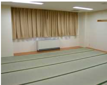
ご宿泊室の一例(10名定員)