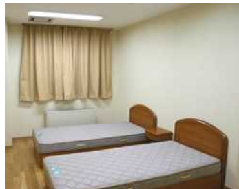
ご宿泊室の一例(2名定員)