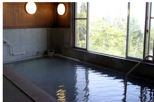
大浴場 天然掛け流し温泉