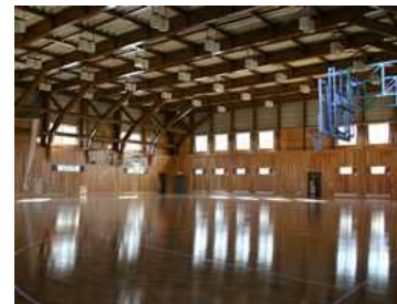
体育館(バスケコート2面の広さがあります)